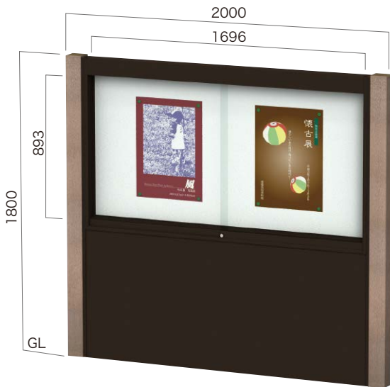
RGP-1810K 腰板付・照明なし ガラス引違いタイプ 設計価格 ¥450,000(外税) 埋込寸法 500mm 本体重量 72kg リサイクルエコウッド支柱