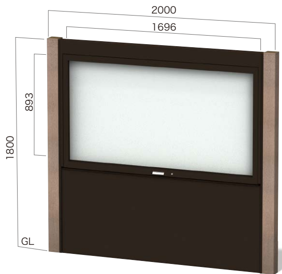
RGS-1810K 腰板付・照明なし ガラスはね上げタイプ 設計価格 ¥538,000(外税) 埋込寸法 500mm 本体重量 67kg リサイクルエコウッド支柱