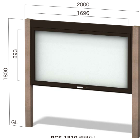
RGS-1810 照明なし ガラスはね上げタイプ 設計価格 ¥417,000(外税) 埋込寸法 500mm 本体重量 57kg リサイクルエコウッド支柱