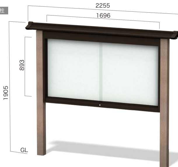
RGP-1810Y 和風ひさし付・照明なし ガラス引違いタイプ 設計価格 ¥434,000(外税) 埋込寸法 500mm 本体重量 66kg リサイクルエコウッド支柱