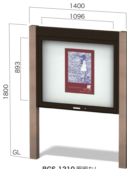
RGS-1210 照明なし ガラスはね上げタイプ 設計価格 ¥356,000(外税) 埋込寸法 500mm 本体重量 45kg リサイクルエコウッド支柱