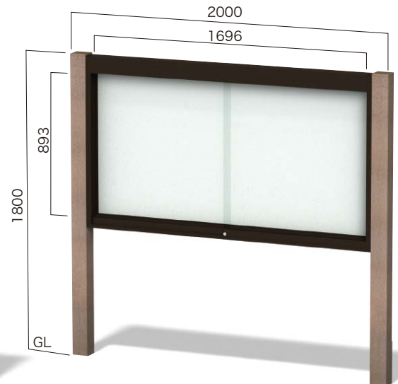
RGP-1810 照明なし ガラス引違いタイプ 設計価格 ¥316,000(外税) 埋込寸法 500mm 本体重量 59kg リサイクルエコウッド支柱