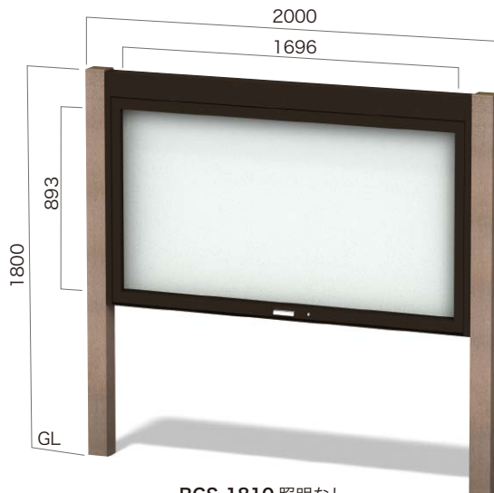
RGS-1810 照明なし ガラスはね上げタイプ 設計価格 ¥417,000(外税) 埋込寸法 500mm 本体重量 57kg リサイクルエコウッド支柱