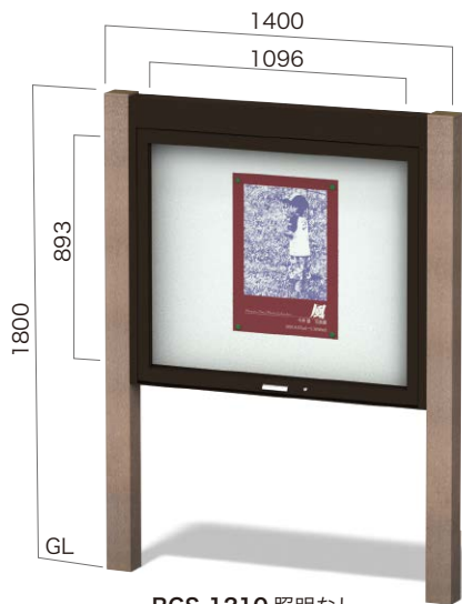
RGS-1210 照明なし ガラスはね上げタイプ 設計価格 ¥356,000(外税) 埋込寸法 500mm 本体重量 45kg リサイクルエコウッド支柱