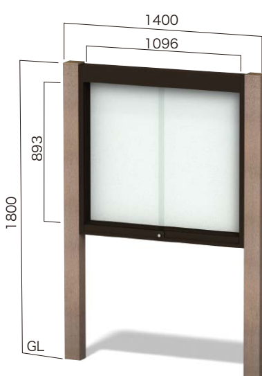
RGP-1210 照明なし ガラス引違いタイプ 設計価格 ¥282,000(外税) 埋込寸法 500mm 本体重量 47kg リサイクルエコウッド支柱